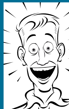
Fig. 3: Individual who got the message